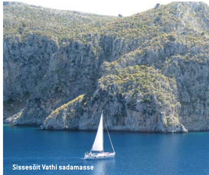
Sissesõit Vathi sadamasse