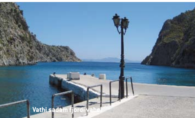
Vathi sadam fjordi vahel