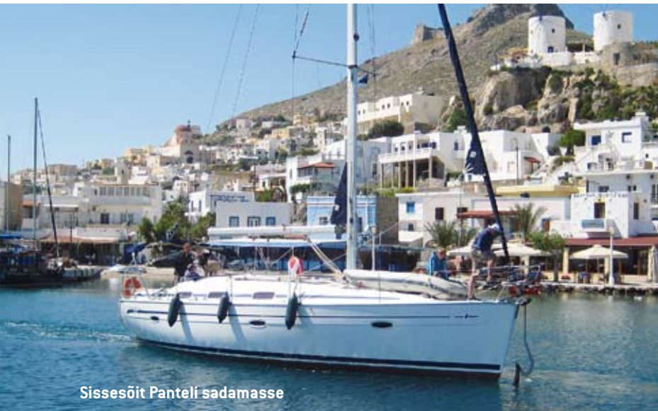
Sissesõit Panteli sadamasse